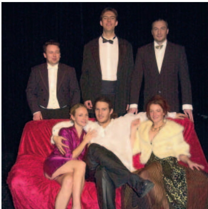
La troupe de "Monsieur Choufleuri"